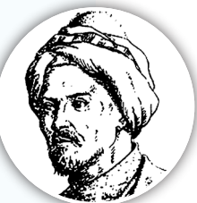
پەزىلەتلىك ئالىم ۋە شەيخ ھەبىبىيەت سۈرپا خانان